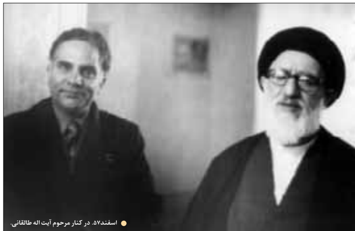
● اسفند ۵۵. در کنار مرحوم آیت اله طالقانی.

بودند که پلیسهای نقابدار در آنها مستقر بودند. هوا هم کاملاً تاریک شده بود.